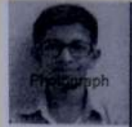
Kankshit Bhaty Dt. 18/09/2015

माध्यमिक विद्यालय परीक्षा (वर्ष : 2017) SECONDARY SCHOOL EXAMINATION (YEAR : 2017)